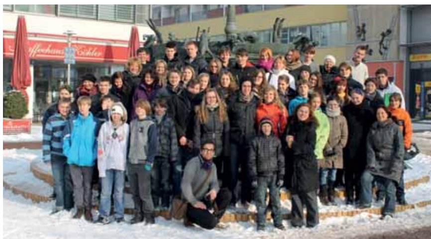
Erste Ideen zum gesamten Radiofeature und den Teilgeschichten entwickelten die Jugendlichen in Magdeburg.